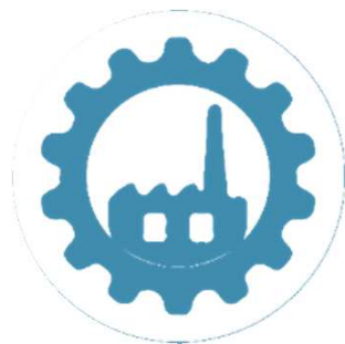
Retrofitting delle macchine